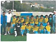
Calcio Calcio, Esordienti 2001: il Pietra ferma la corsa del Vado