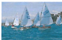
Vela: ottimo successo per la regata dei Golfi