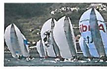
Vela: per Loano un altro week end targato Audi Sailing Series