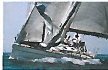
Nel weekend a Varazze la quarta Beneteau Cup - Banks Sails Regatta