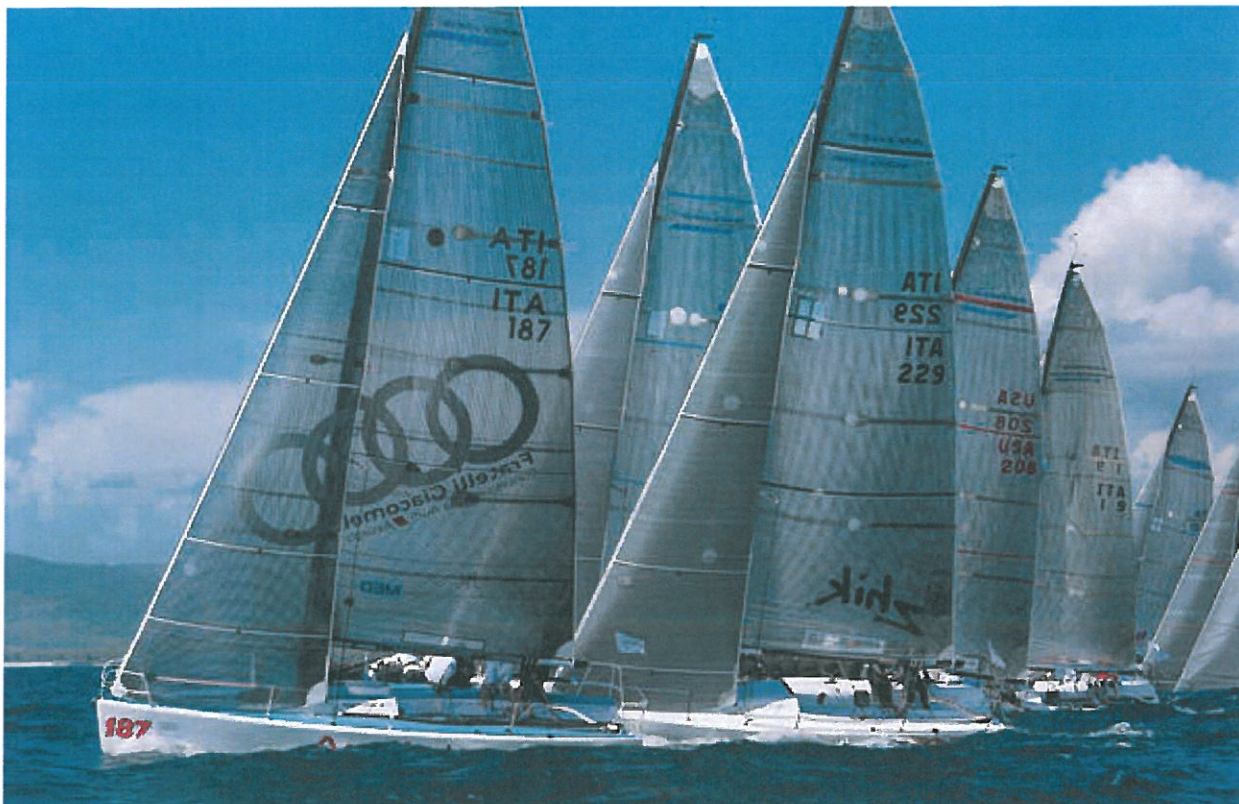
Vela: Audi Sailing Series Melges 32 a Portoferraio