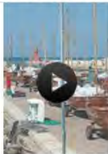
Castiglione della Pescaia 1-3 Giugno