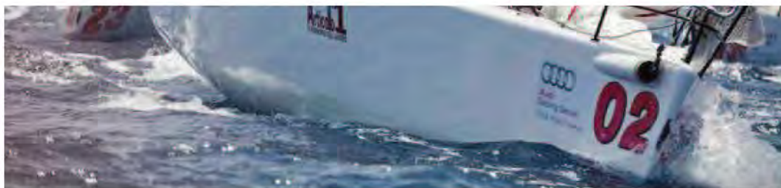
Vela: Melges 32, Fantastica