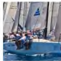
Fantastica (clicca per ingrandire)