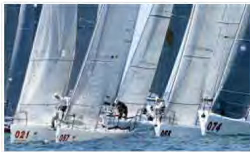
Il Mondiale ha inizio