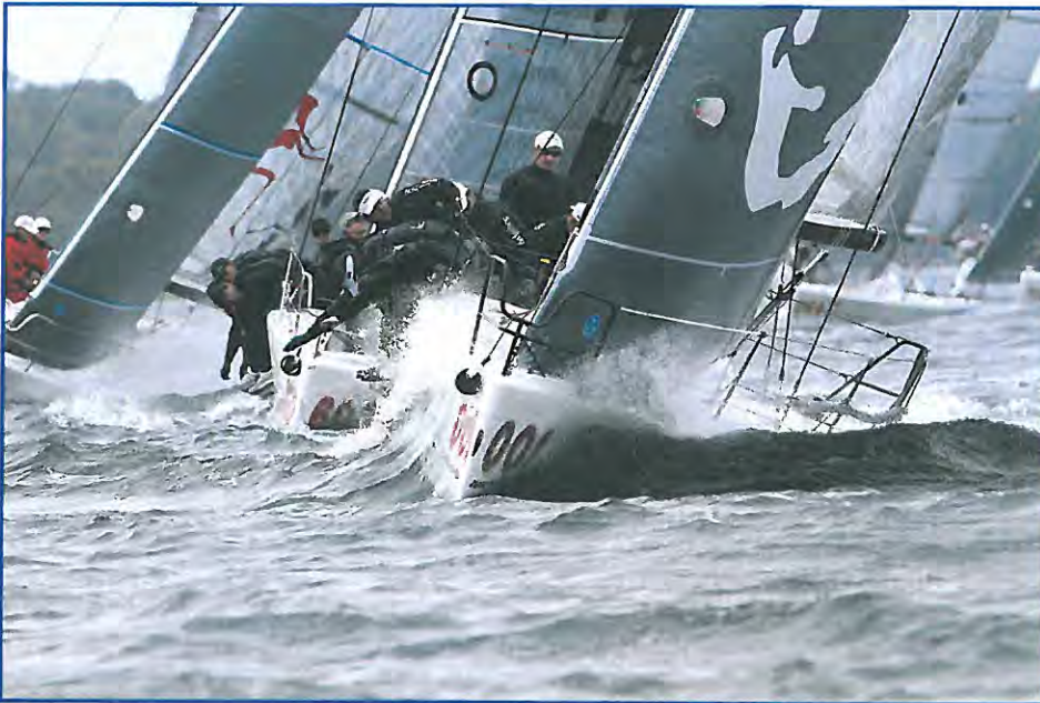
La flotta dei Melges 32.

Per giovedì 28 settembre la partenza della prima regata è fissata alle 11 locali.