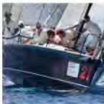
Mascalzone Latino (clicca per ingrandire)