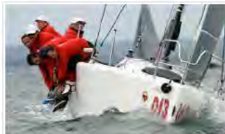
Samba Pa Ti è Campione del Mondo Melges 32